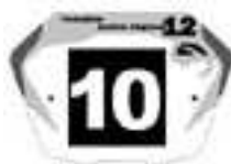
Junior Fet G / en 20'' et Cruiser