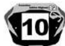
Elite1 Fet G en 20'' et Cruiser