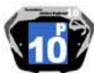
Filles / Femmes

Fond de plaque formé d'un carré de 10 cm de côté avec des chiffres d'une hauteur de 80mm mini et 8 mm d'épaisseur et d'une lettre de 40 mm de hauteur